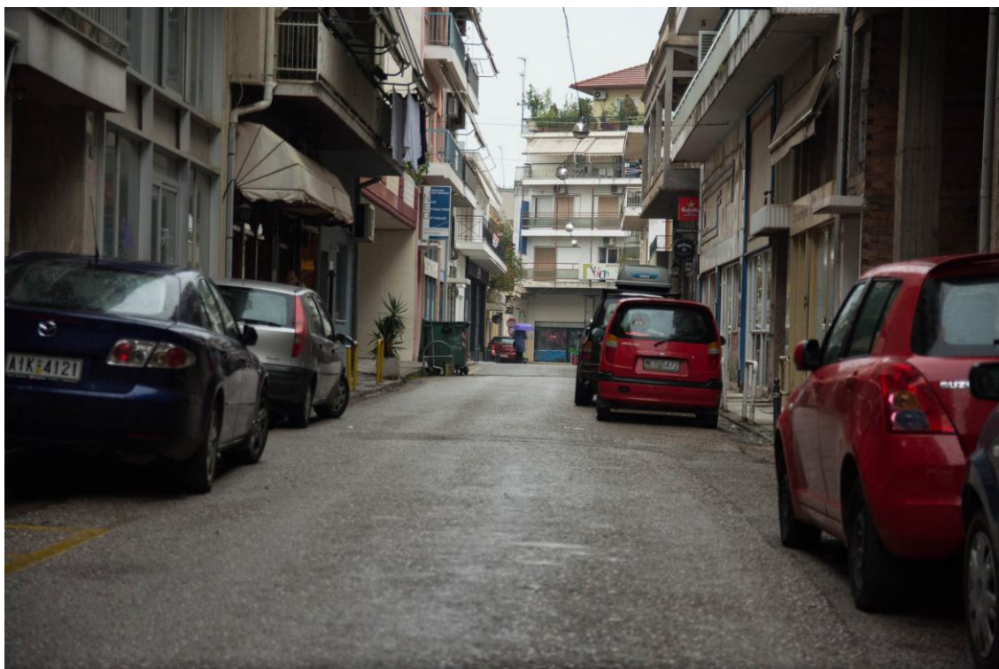
ΑΠΟΨΗ ΟΔ. 11 ΗΣ ΙΟΥΝΙΟΥ