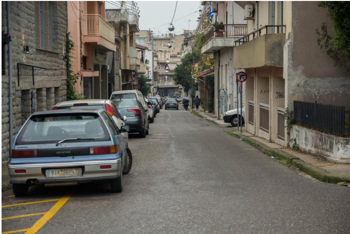
ΑΠΟΨΗ ΟΔ. ΖΕΡΒΑ