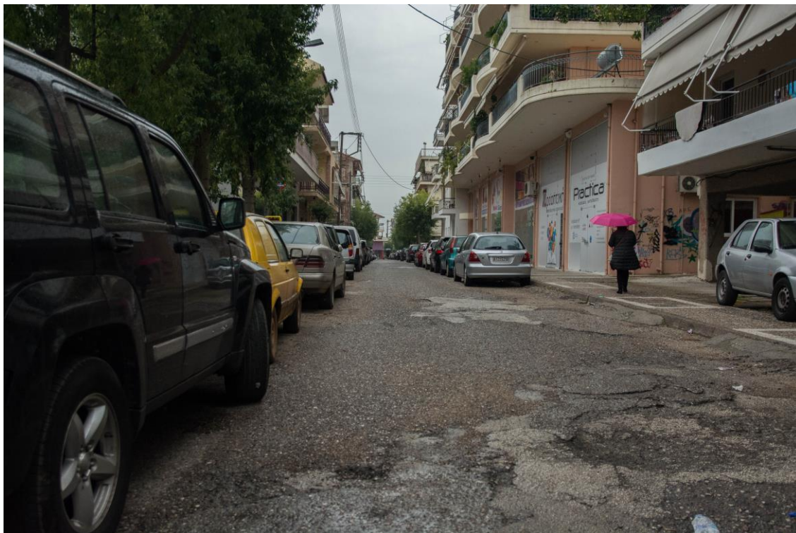
ΑΠΟΨΗ ΟΔ. ΜΕΛΕΑΓΡΟΥ