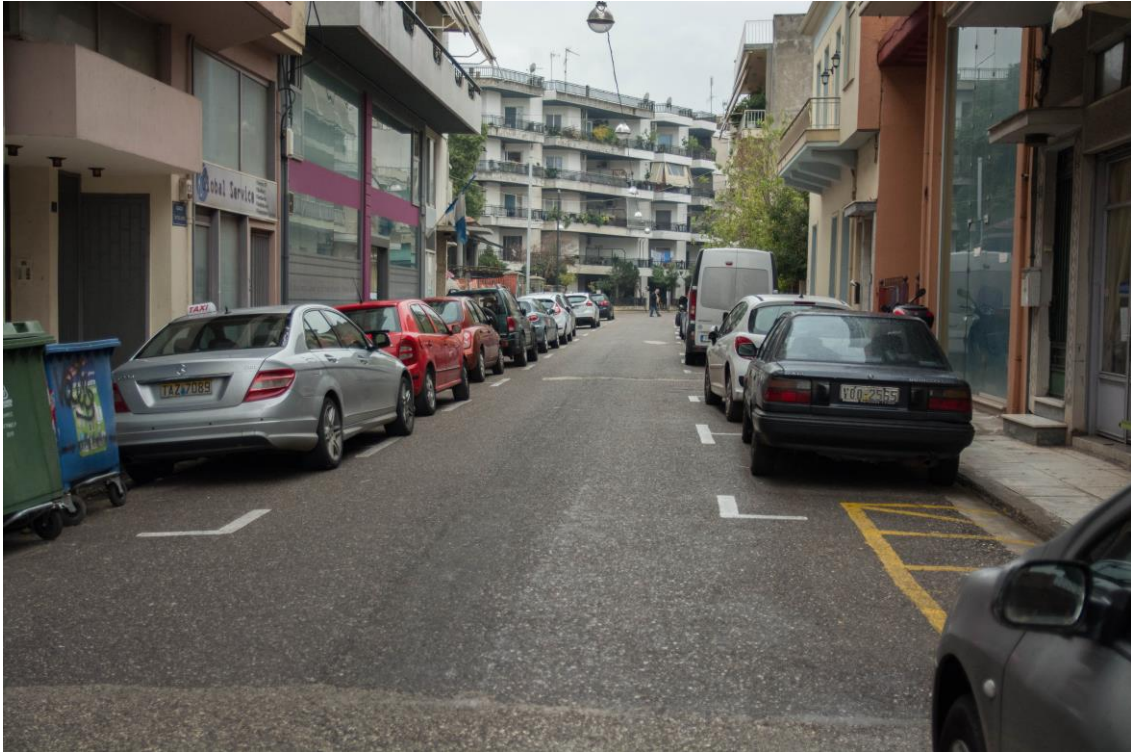
ΑΠΟΨΗ ΟΔ. ΕΛΥΤΗ