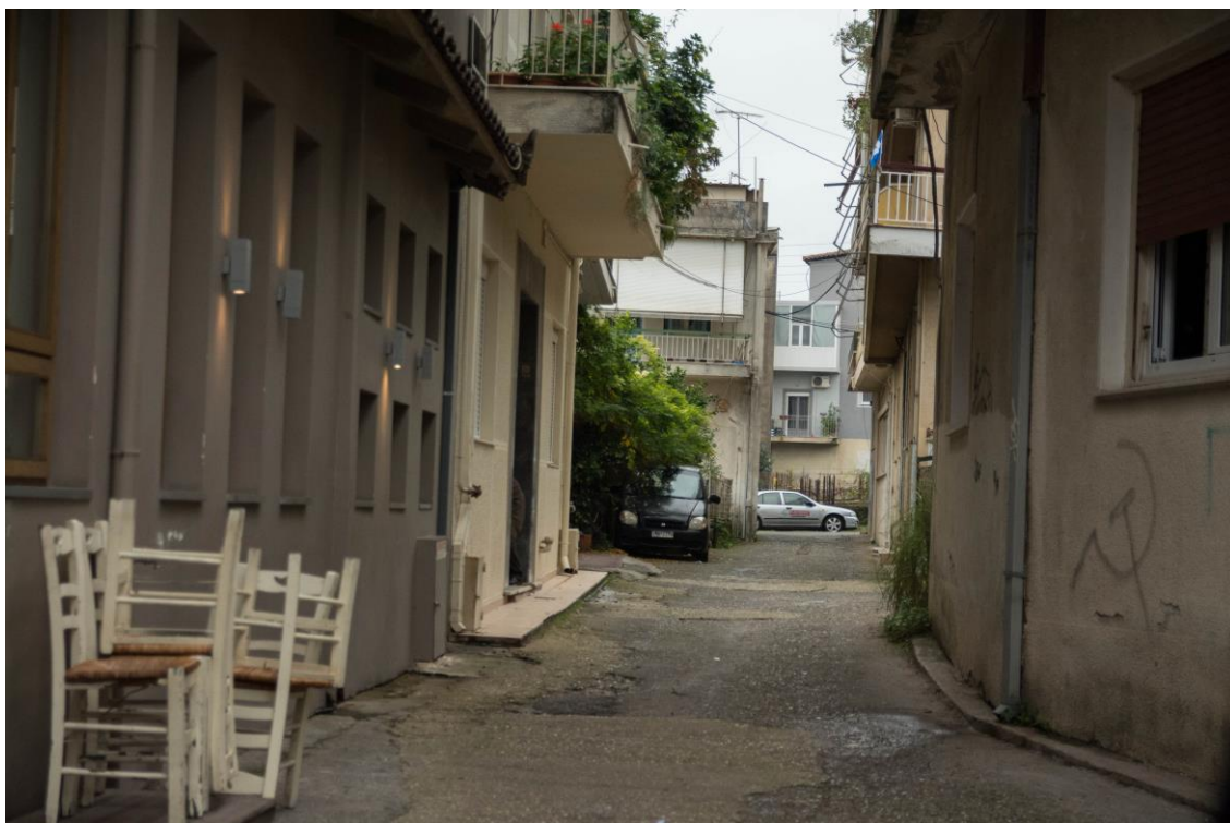
ΑΠΟΨΗ ΠΕΖΟΔΡΟΜΟΥ ΠΛΑΤΩΝΟΣ