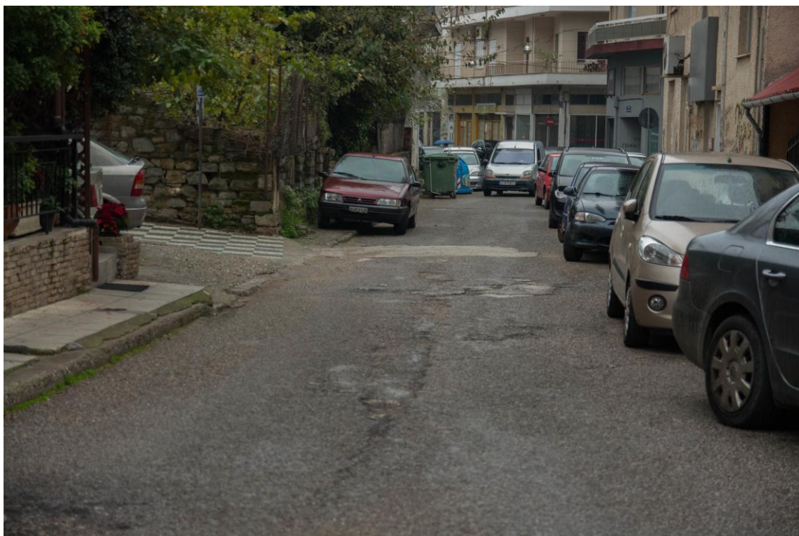
ΑΠΟΨΗ ΟΔ. ΣΩΚΡΑΤΟΥΣ (ΠΑΡΟΔΟΣ ΑΠΟ ΟΔ. ΔΗΜΟΤΣΕΛΙΟΥ)