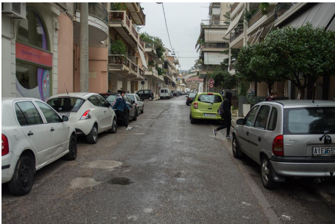
ΑΠΟΨΗ ΟΔ. ΜΕΛΕΑΓΡΟΥ