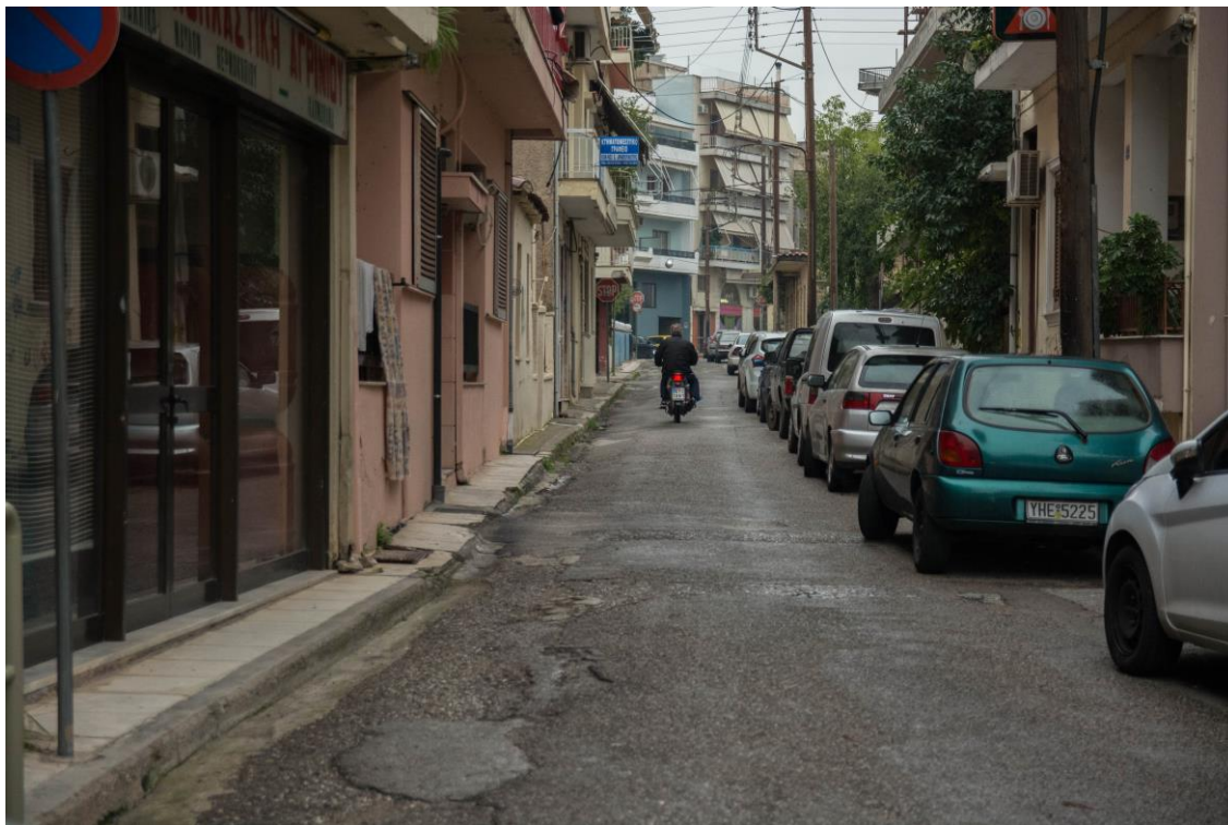
ΑΠΟΨΗ ΟΔ. ΣΩΚΡΑΤΟΥΣ