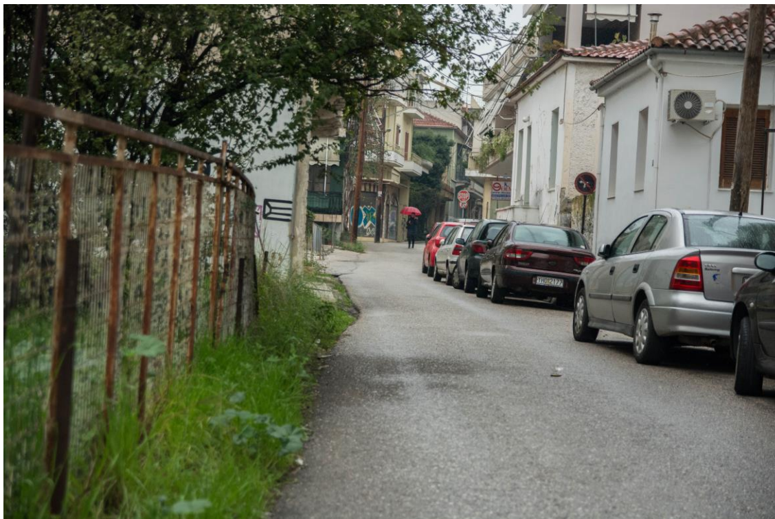
ΑΠΟΨΗ ΟΔ. ΓΑΛΑΝΗ