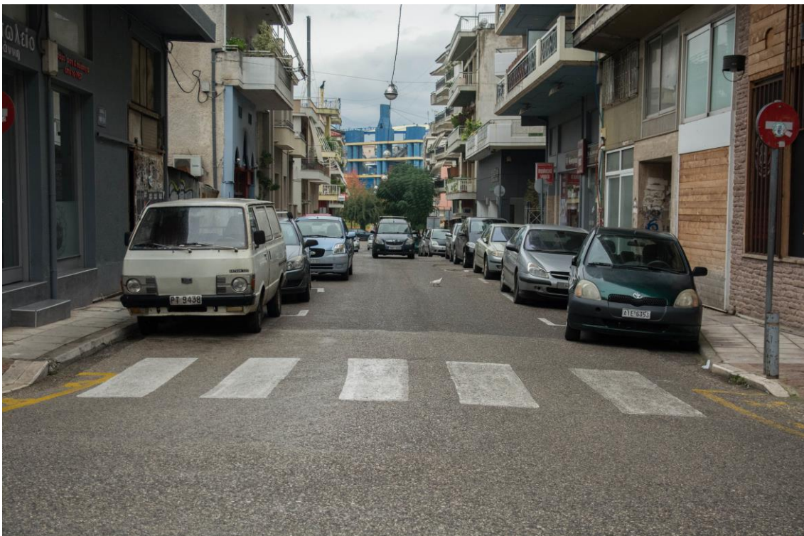
ΑΠΟΨΗ ΟΔ. ΡΙΤΣΟΥ