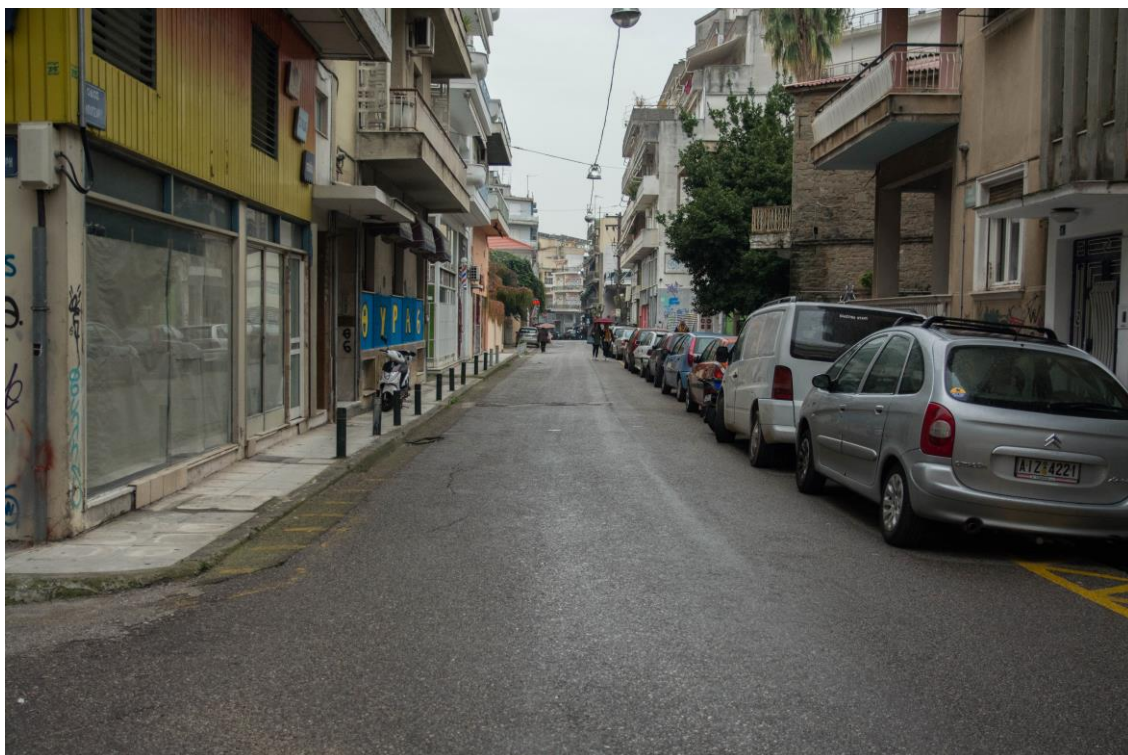
ΑΠΟΨΗ ΟΔ. ΜΠΟΤΣΑΡΗ