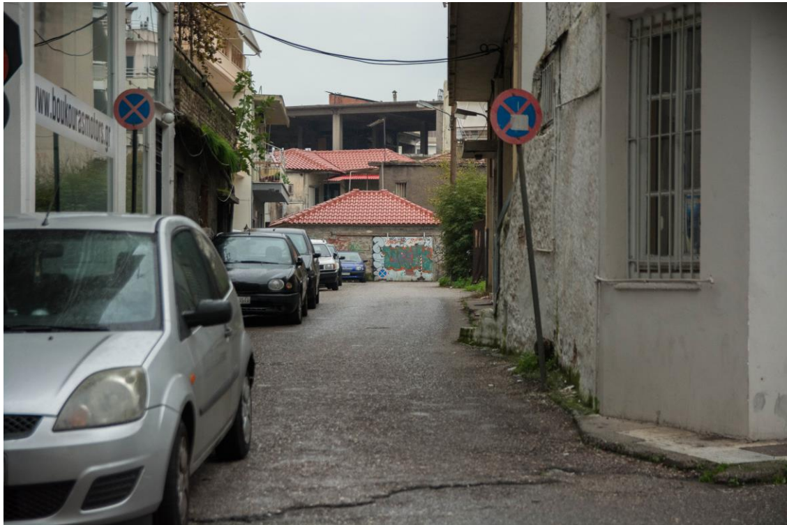
ΑΠΟΨΗ ΠΕΖΟΔΡΟΜΟΥ ΑΕΤΟΡΑΧΗΣ