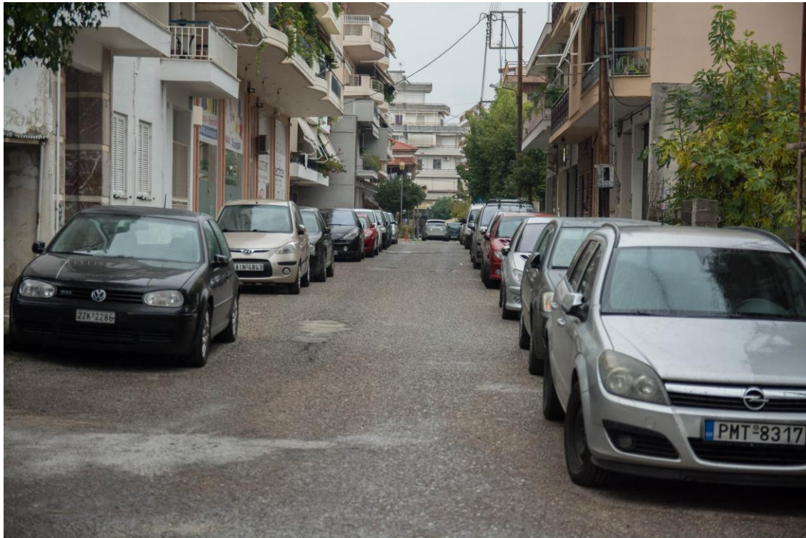
ΑΠΟΨΗ ΟΔ. ΣΜΥΡΝΗΣ