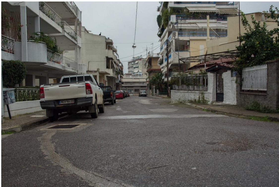
ΑΠΟΨΗ ΟΔ. ΠΑΛΑΙΟΛΟΓΟΥ