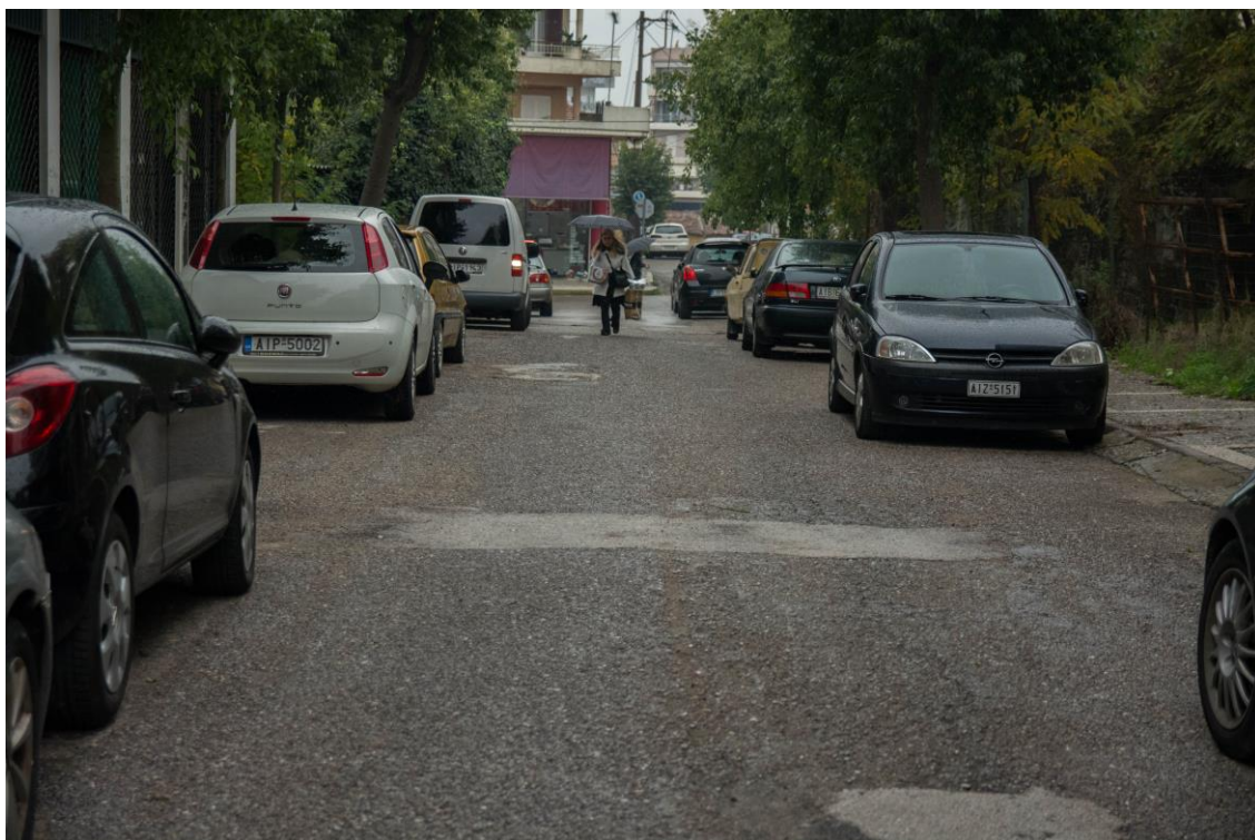
ΑΠΟΨΗ ΟΔ. ΣΜΥΡΝΗΣ