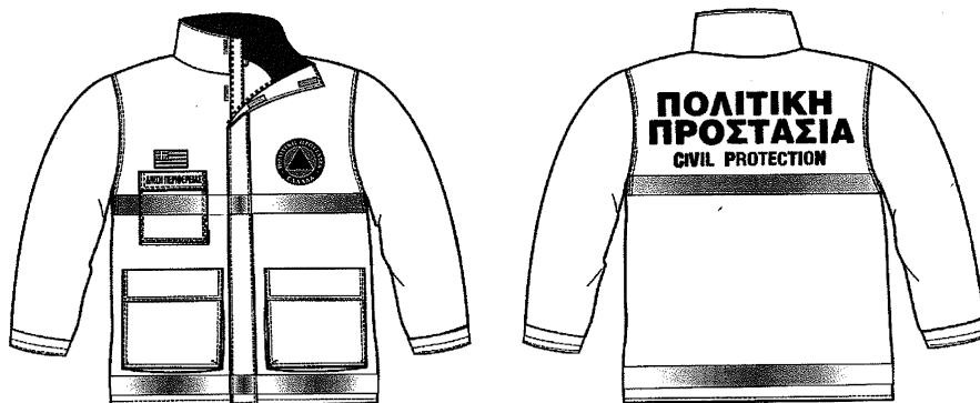
Σχέδιο 1. Επιχειρησιακό μπουφάν Πολιτικής Προστασίας

ΠΡΟΔΙΑΓΡΑΦΕΣ ΕΠΙΧΕΙΡΗΣΙΑΚΟΥ ΜΠΟΥΦΑΝ ΠΟΛΙΤΙΚΗΣ ΠΡΟΣΤΑΣΙΑΣ