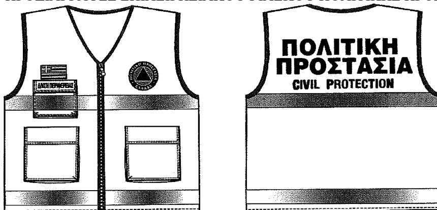
Σχέδιο 2. Επιχειρησιακό γιλέκο Πολιτικής Προστασίας