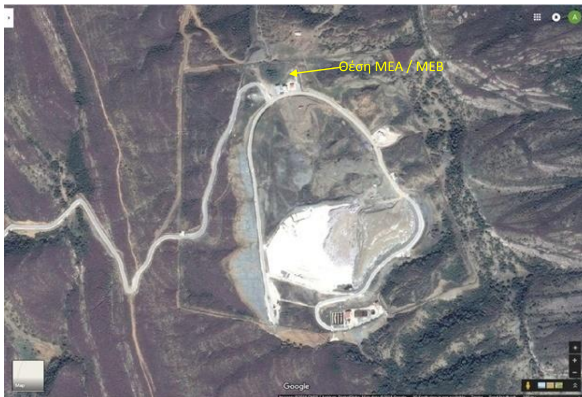
Εικόνα 1: Αεροφωτογραφία του ΧΥΤΑ 2ης Δ.Ε.Ν. Αιτ/νίας και θέση της Μονάδας Επεξεργασίας Απορριμμάτων (ΜΕΑ) και Μονάδας Επεξεργασίας Βιοαποβλήτων (ΜΕΒ).

Οι διαγωνιζόμενοι πρέπει να σχεδιάσουν το έργο εντός της διαθέσιμης έκτασης, λαμβάνοντας υπ' όψη το ενδεχόμενο άσκησης του δικαιώματος της προαίρεσης επέκτασης των εγκαταστάσεων εντός του χρόνου κατασκευής. Η Προμελέτη των έργων Προαίρεσης δίνει ενδεικτικά τέτοια λύση πιστοποιώντας την επάρκεια του χώρου.